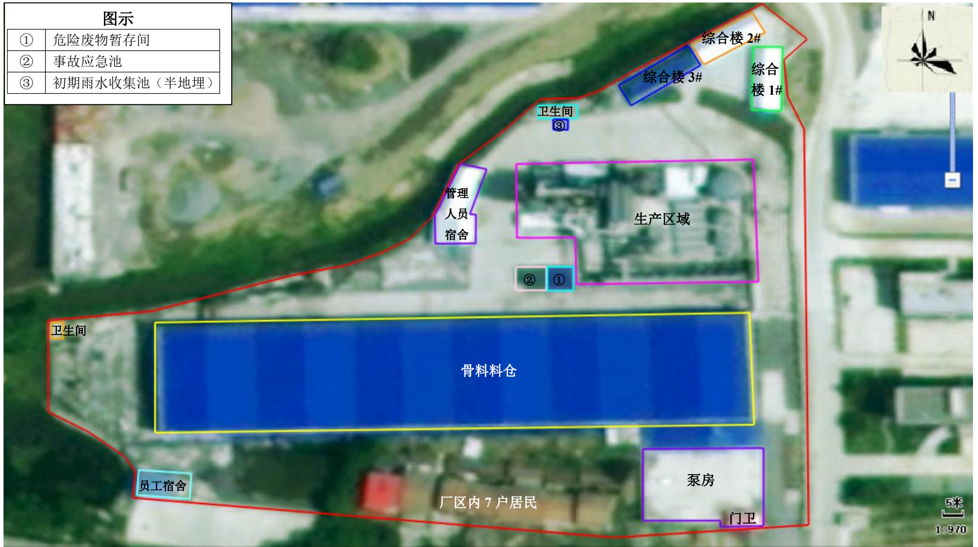
附图 4 平面布置图