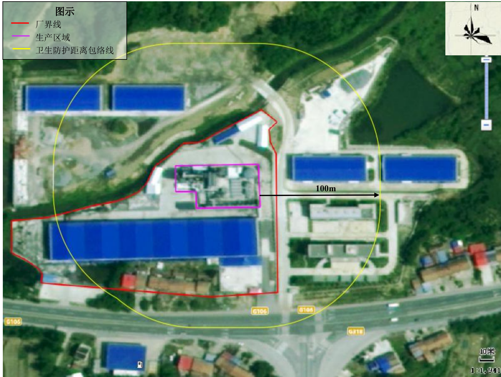
附图 6 卫生防护距离包络线图