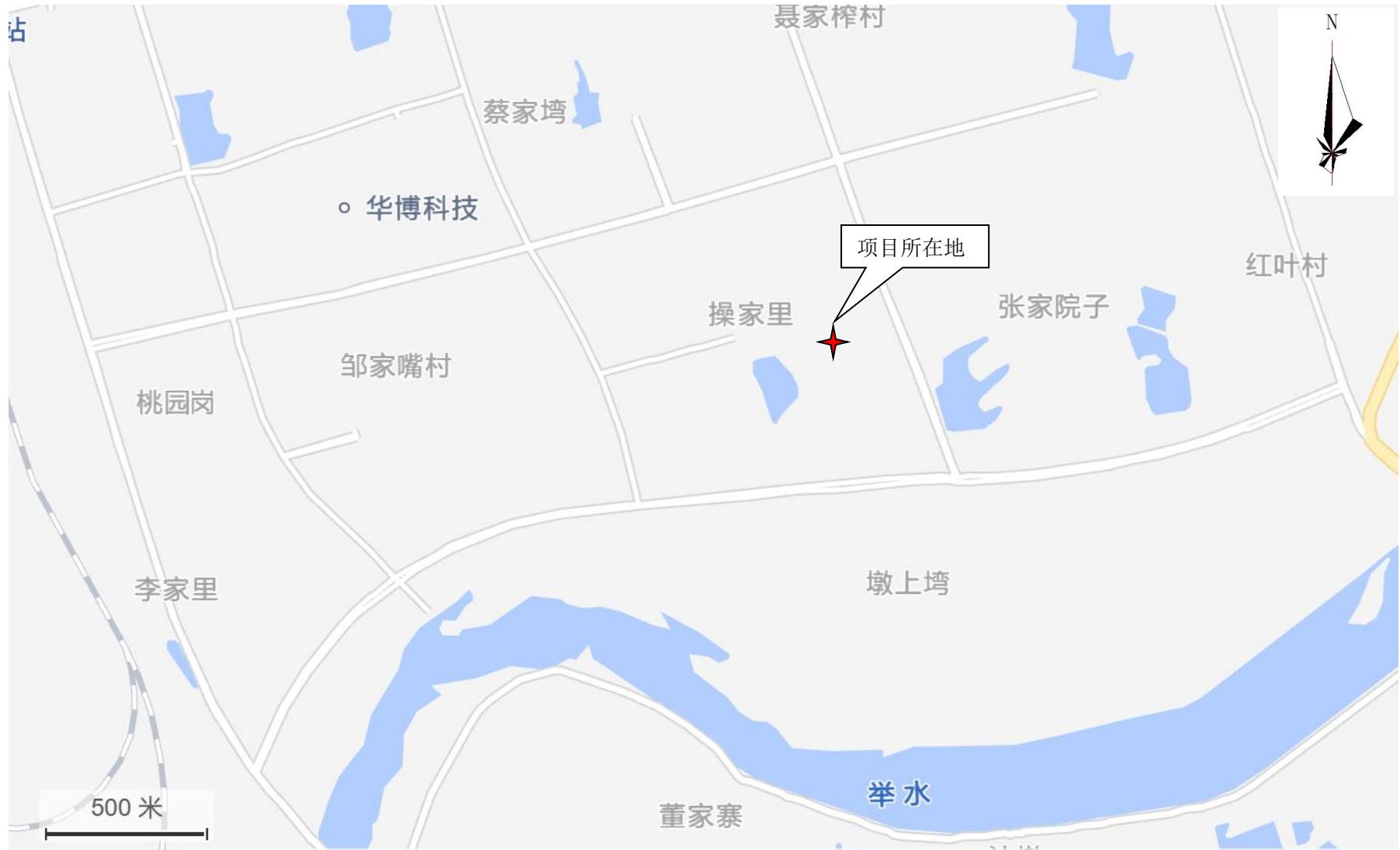
附图1 项目地理位置图