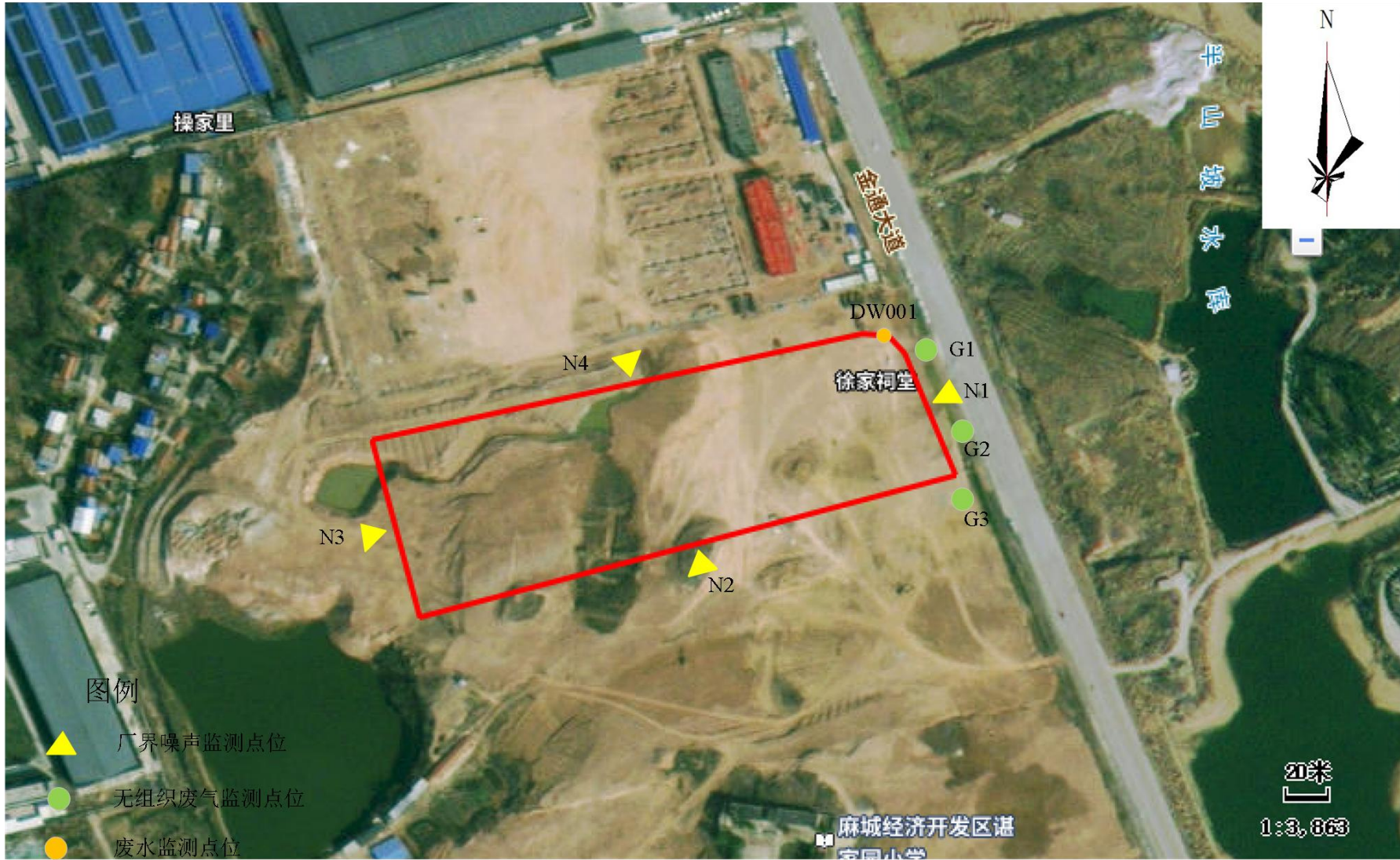
附图4 项目监测点位图